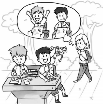
ภาพข้อสอบการเขียนเรื่องจากภาพ ปีการศึกษา 2561