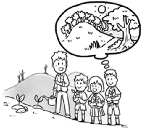
ภาพข้อสอบการเขียนเรื่องจากภาพ ปีการศึกษา 2562