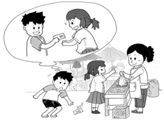
ภาพข้อสอบการเขียนเรื่องจากภาพ ปีการศึกษา 2560